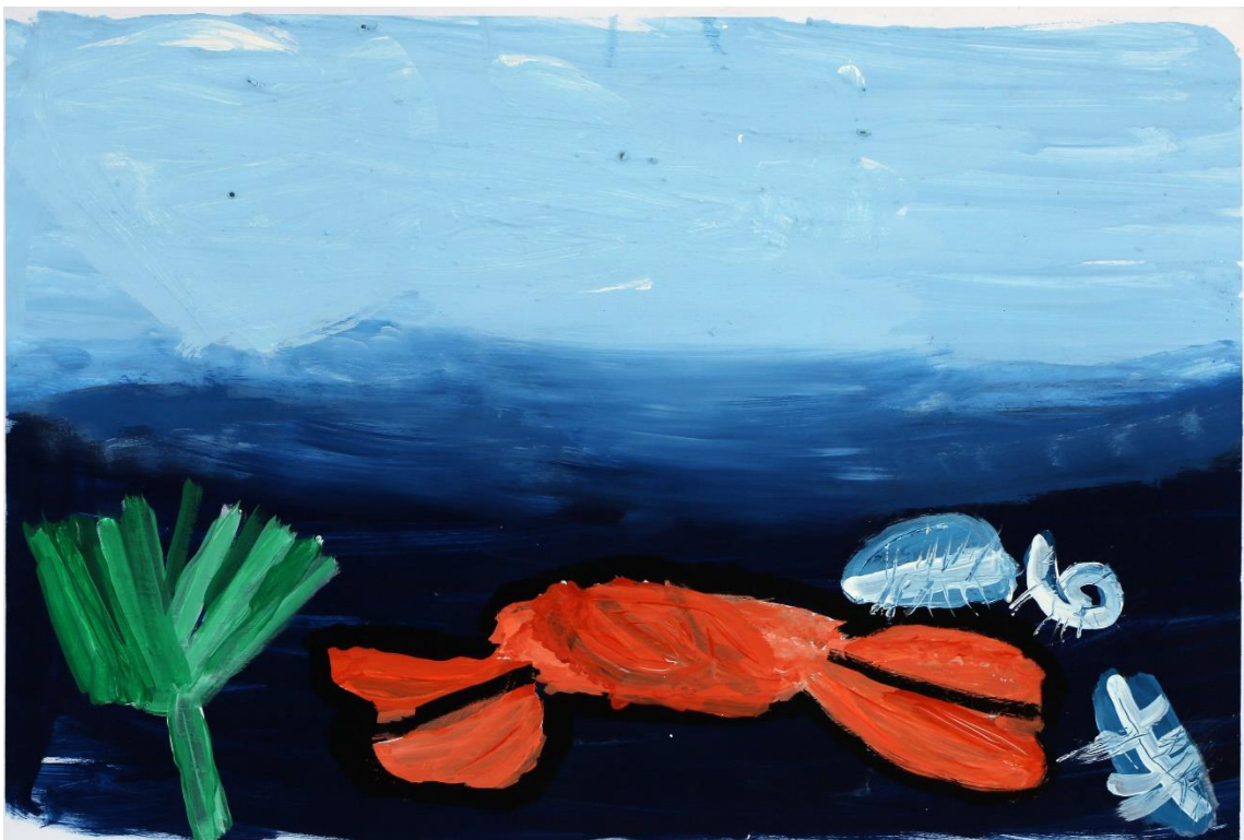
„Tauchender Krebs“ von Dorothea Müller