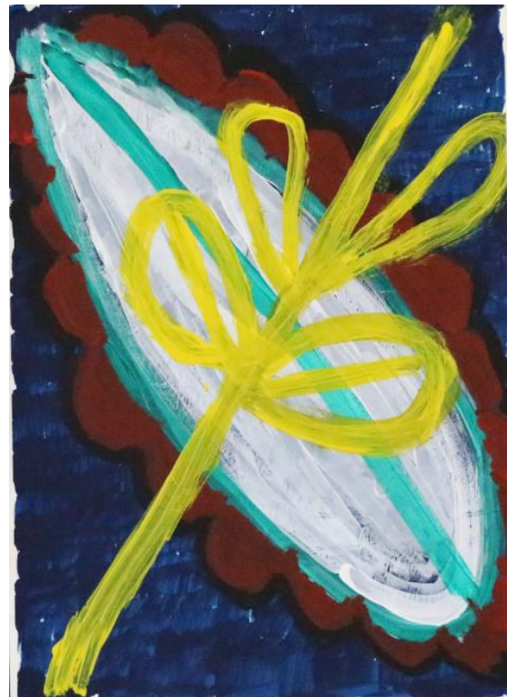
„Nachtfalter“ von Dorothea Müller

Ich hoffe, dass ich in Zukunft noch erfolgreicher bei der Kunst werde.