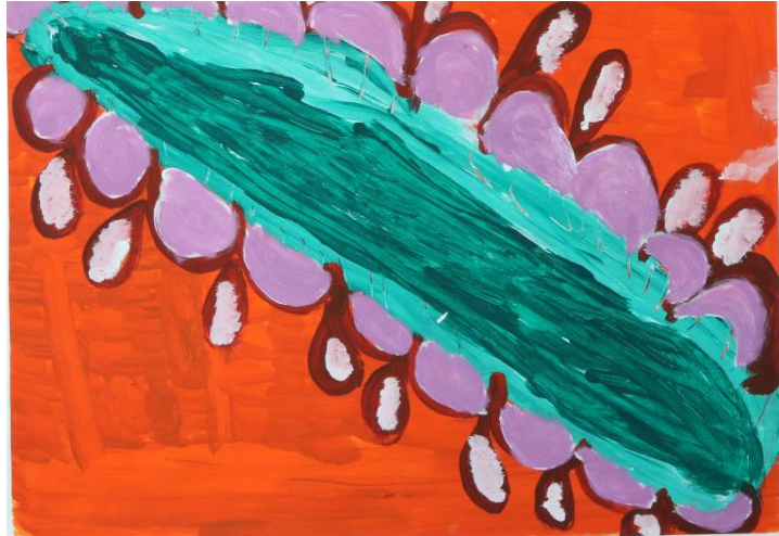
„Lavendelblüte“ von Dorothea Müller

Ich arbeite mit Acrylfarben und Papier. Die Acrylfarbe wird übereinandergeschichtet und vermischt. Und zusätzlich, kann man es öfters übermalen und es ist nicht gleich das ganze Werk weg, wenn mir eine Sache nicht gefällt. Meine Bilder sind mit kräftigen Farben gemalt und kontrastreich und leuchten deswegen besonders.