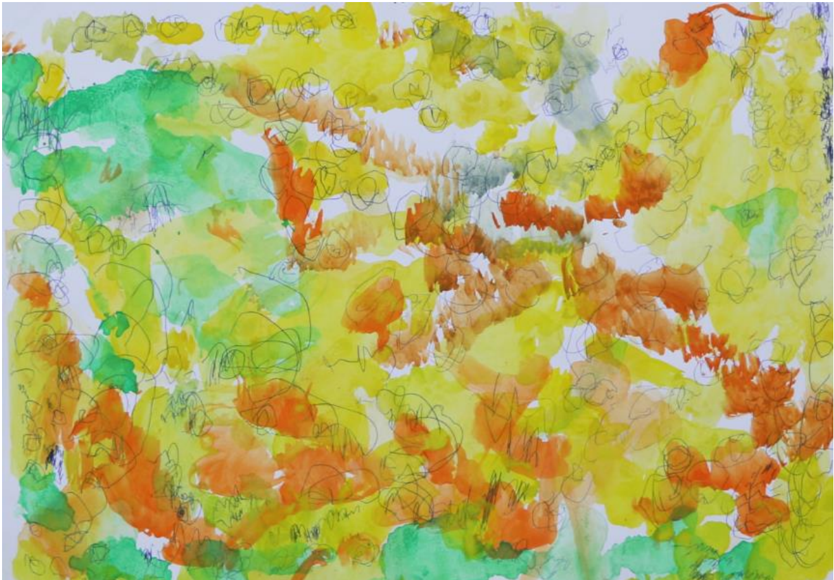
Cliff Hoppe – Cooles Bild mit Blumen (2021)