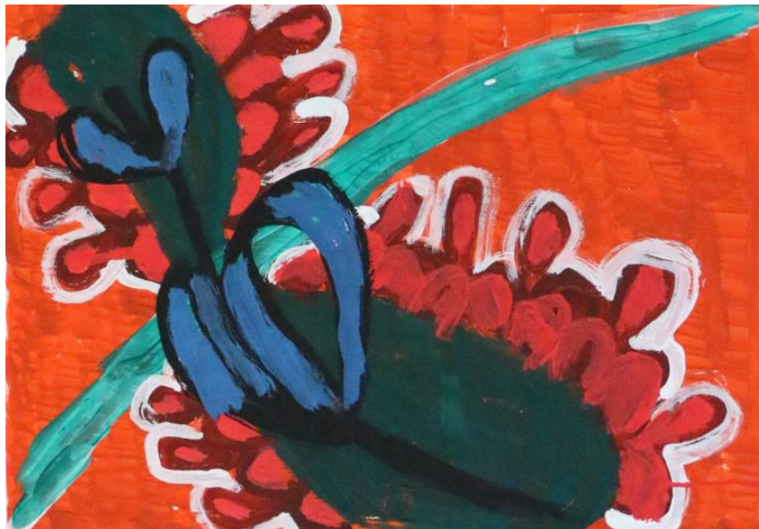
Dorothea Müller - Lavendelblüte

Besuche sind weiterhin nur per Anmeldung möglich, unsere Kunstprodukte können aber natürlich telefonisch oder per Mail bestellt werden.