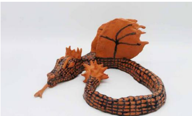
Andreas Stejskal – Schlangendrochen (2020)

Auch dieses Mal wollen wir Ihnen im Newsletter einen der Künstler aus dem KreativWerk näher vorstellen und Ihnen so einen Einblick in deren Schaffensweise ermöglichen. Nur durch deren Fantasie und Schaffensdrang wird das KreativWerk zu dem, was es ist: ein Ort, an dem Menschen mit und ohne Behinderung sich auf künstlerischer Ebene begegnen können, um voneinander zu