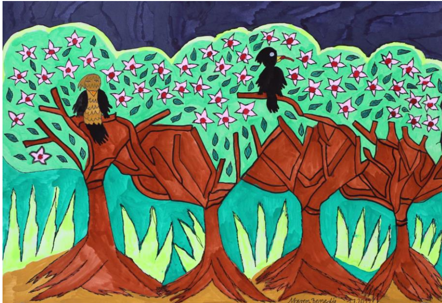
Maren Benedix – Kirschblütenbaumallee

Kleine Information am Rande: Mit dem Abschluss des Projektes steht eine Arbeitszeitverkürzung von Frau Luft an – sie wird in Zukunft nur noch von Dienstag bis Freitag im KreativWerk anwesend sein.